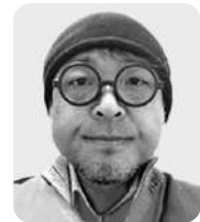
【講師プロフィール】

申込方法：2月28日(金)まで、気仙沼市社協（電話 22-0709）へお申し込みください。