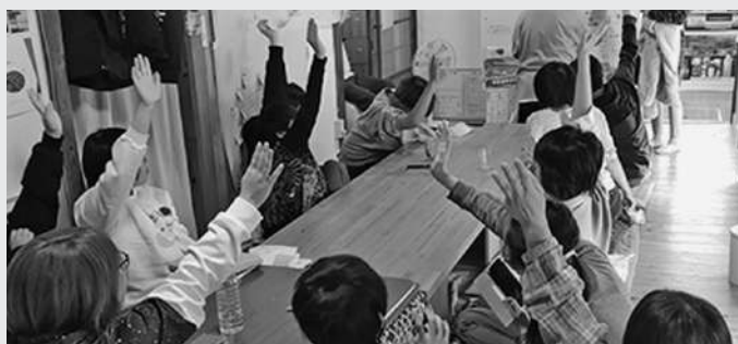
不登校・ひきこもりの子ども・若者の居場所づくり