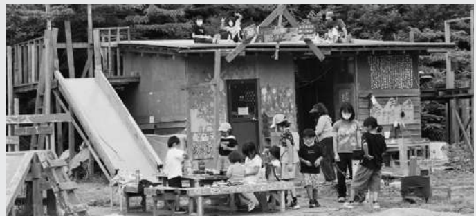
冒険遊び場による子どもの居場所づくりin気仙沼

気仙沼市内からは、今回紹介の2団体がエントリーしており、募集期間は2月28日までです。