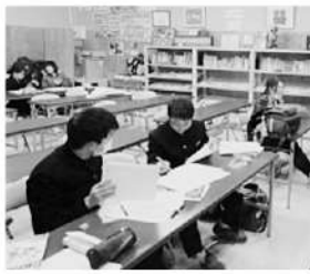
子どもたちの自主学習スペースとして活用(移設前の様子)

震災後から鹿折中みなど町に開設されていたコミュニティスペース「サライ」は、集会所としてはもちろん、児童の自習の場、写経・書道・料理教室、催しもの会場等として大いに活用され、年間3000人の利用があり、地域の中で非常に大きな役割を果たしています。