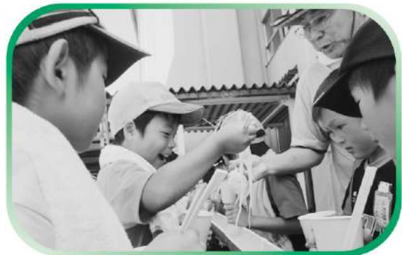
流しソーメン大会 - 面瀬学童保育センターなかよしハウス -