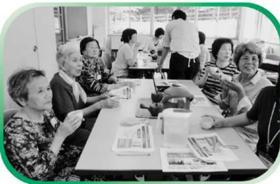
心カフェ おいしいお茶のいれ方講座 - 唐桑地区 -