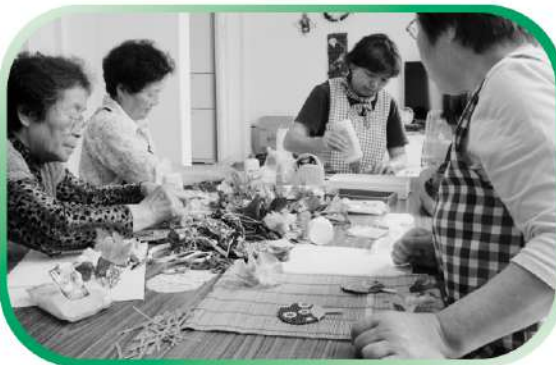
すだれを使って壁かけづくり - 小泉小学校住宅 -