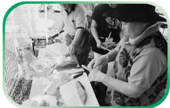
合同夏祭り - 東新城3仮設住宅 -