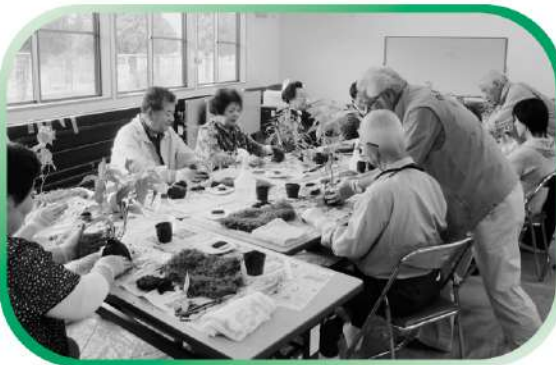
結工房 苔玉づくり - 西地区 -

本吉支所 ◆ 気仙沼市本吉町津谷館岡51番地6〈本吉老人福祉センター内〉 TEL 0226-42-2231 / FAX 0226-42-1241 E-mail: moto-sha@kind.ocn.ne.jp