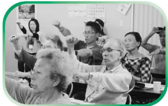
目の健康講座&目の体操 - 旧千厩中学校住宅 -